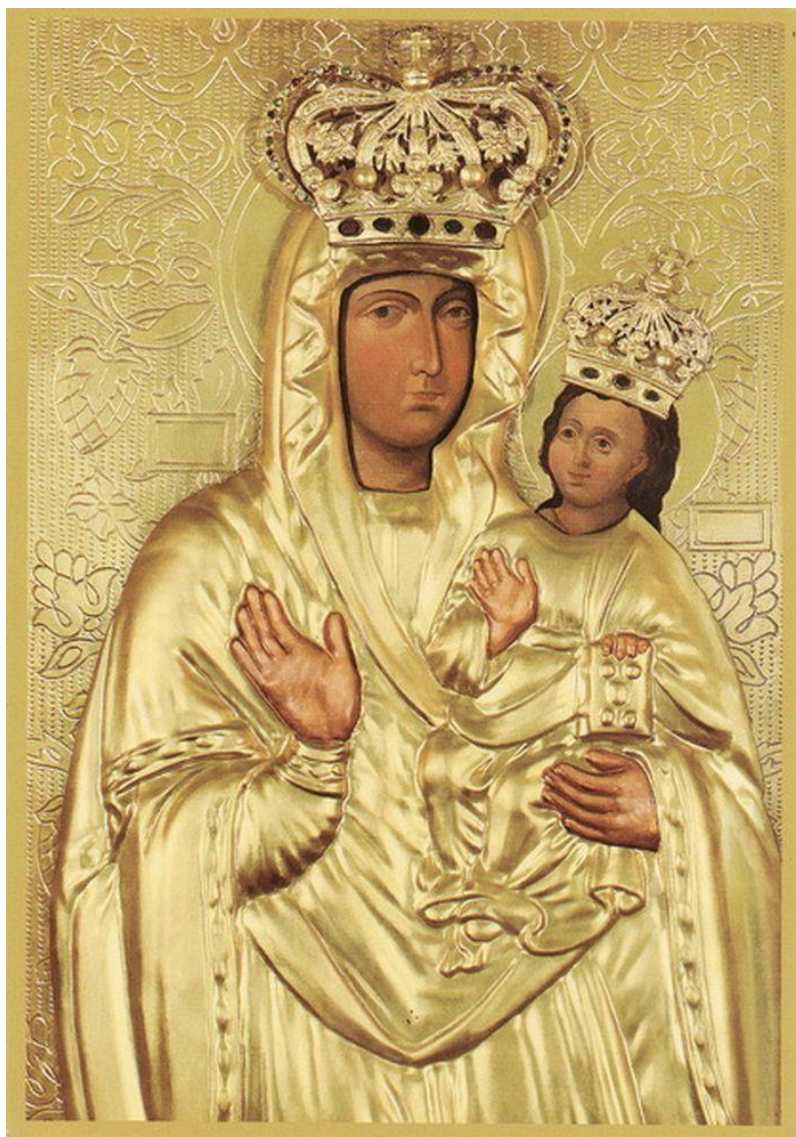
VOR FRUE AF ZARWANICE, UKRAINE